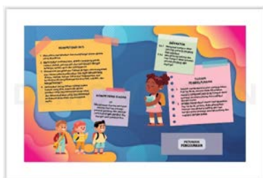
Gambar 1. Bagian Awal

Tahap pertama dalam pembuatan media pop up book yakni membuat rancangan awal berupa storyboard . Pengembangan media pembelajaran yang dihasilkan terdiri dari tiga bagian yaitu bagian awal, inti dan akhir: