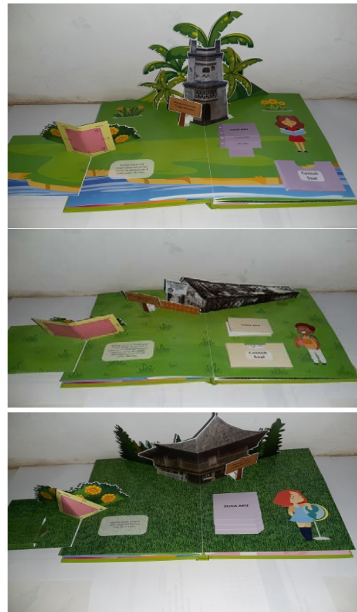
Gambar 2. Bagian Isi

dengan panduan cara menggunakan media pop up book .