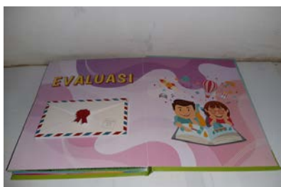
Gambar 3. Bagian Akhir

Pada bagian akhir menampilkan evaluasi berupa soal-soal yang berhubungan dengan bangun datar (persegi/ persegi panjang dan segitiga), soal-soal tersebut terdapat dalam kantong.