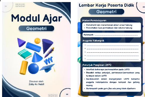
Gambar 1 Halaman Sampul Bahan ajar dan LKPD

Berikut hasil pengembangan LKPD yang telah dilakukan.