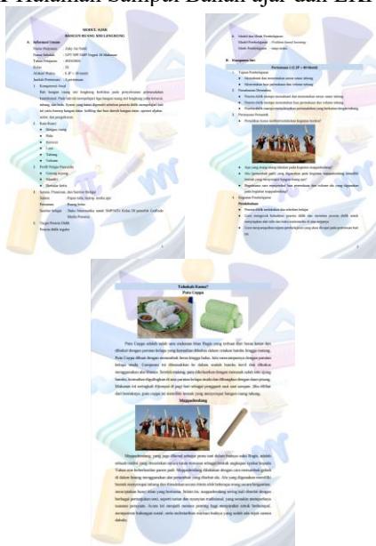
Gambar 2 Tampilan Isi Bahan ajar dan LKPD